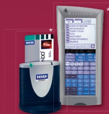
Omnikey® & Orderman®

Immer wieder neue, ungewöhnliche Produkte und Serviceideen entwickeln – und zwar in Premiumqualität. Das ist das beste Rezept, um Kunden zu binden und die Ertragslage langfristig zu festigen. Mit dem individuell konfigurierbaren und netzwerkfähigen Kassensystem UP-800 lässt sich dieses Rezept jetzt noch schneller realisieren. Die einfach gute und intuitive Bedienung über den 6,5" großen Touchscreen und die übersichtliche Flachastatur ermöglicht es selbst ungeübtem Personal, schnell ungeahnte Kundenwünsche oder komplexe Artikelbewegungen fehlerfrei und effizient einzugeben. Kosten durch fehlerhafte Bedienung werden erheblich reduziert. Die UP-800 ist eben alles, außer gewöhnlich.